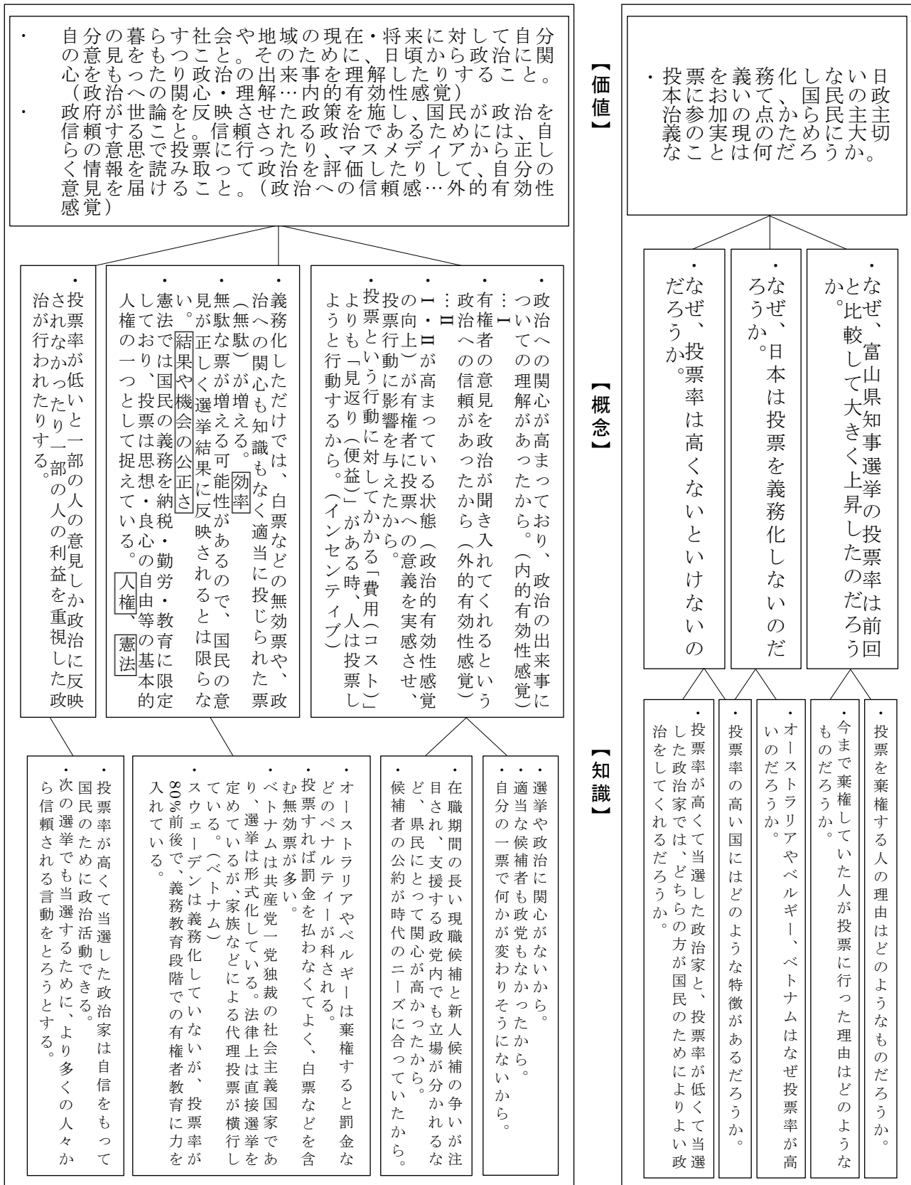
「社会的見方・考え方の成長過程図 (知識の構造図)」